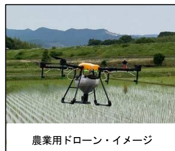
農業用ドローン・イメージ